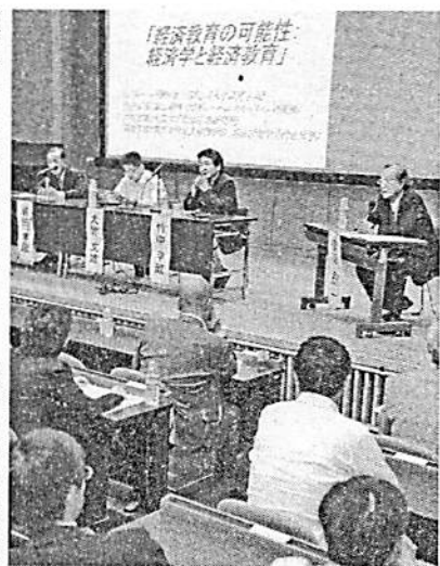
経済教育のヒントとなる議論を熱心に聞く教師たち(5日、日大経済学部7号館講堂で)

子供たちにとどのよう わかりやすく経済を教え るのかをテーマにしたシ ンポジウム「明日の経済 教育を考える」が今月5 日、東京・千代田区の日 本大学で開かれた。中学 や高校、大学の教員ら約 120人が参加する中、 「市場主義」や「社会保 障」を紹介した中学の授 業の実践例を巡って、パ ネリストたちが熱い議論 を交わした。 主催したのは「経済教 育ネットワーク」。06年 6月に発足した同ネット ワークは、健全な資本主 義のあり方を子供に教え る機会が必要だととして、 全国の大学の経済学部の 教授らが、中学や高校の 教員向けに経済教室など を開いている。 今回のシンポジウムは 2部構成。このうち「中 学・高校における経済教 育が克服すべきもの」を